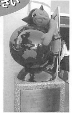
校舎玄関前にあります

多数の皆様のご参加をお待ちしております。 駐車場がありませんので、車でのご来場はご遠慮下さい。