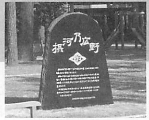
「城南校舎記念碑」 城南3丁目第2公園

総会にご出席の方は下記のいずれかの方法にて 4月30日までにご連絡下さい。 (御欠席の方は連絡不要です)